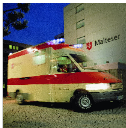
Einsatzwagen der Malteser

Nicht genug: Im vergangenen Jahr schulten die Malteser in Passau 2.830 Menschen für den Erste-Hilfe-Einsatz. Diese Zahlen sind nur möglich durch ein hohes Ehrenamtliches Engagement. Neben 95 Angestellten leisten rund 660 ehrenamtliche Helfer wertvolle Arbeit.