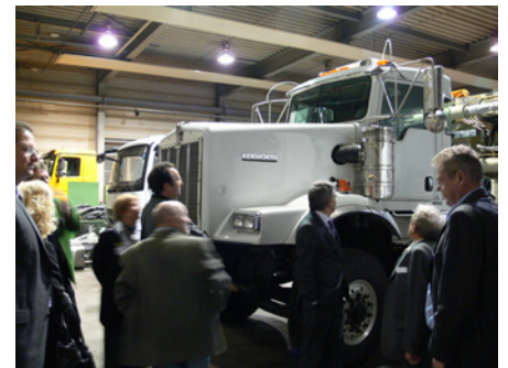
Führung bei Paul Nutzfahrzeuge

Und so entstehen in den Hallen, die wir unter kompetenter Führung gruppenweise