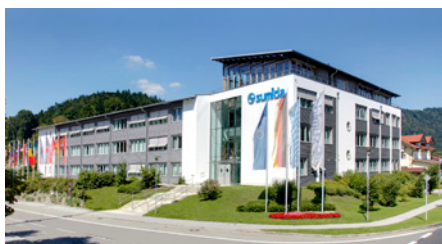
Unternehmensstandort in Erlau