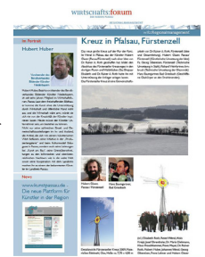
Dokumentation „Kunst im öffentlichen Raum“

form zur Dokumentation und Präsentation der zeitgenössischen bildenden Kunst in der Region sowie zur Vernetzung der Künstler zur Verfügung. Die Freischaltung des Portals erfolgte am 2. April 2011. Kulturschaffende und Kunstinteressierte sind aufgerufen, die Plattform mit Inhalten, wie aktuellen Meldungen zur zeitgenössischen bildenden Kunst in der Region, Terminen, Sammlungen oder einem eigenen Portrait zu füllen.