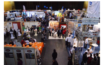
Blick auf die Ausbildungsmesse 2011

diesem Jahr erstmalig im Frühjahr stattfand. Das Thema „Berufsorientierung“ prägte dieses Mal auch die offizielle Eröffnungsfeier, bei der erstmalig das Berufswahl-SIEGEL der Region Passau durch das Regionalmanagement verliehen wurde.